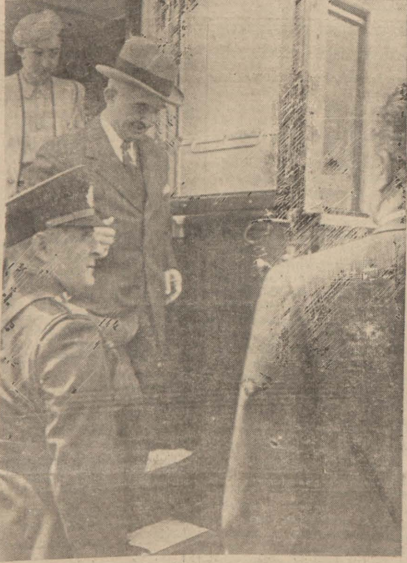
Millî Şef trenden inerlerken

Millî Şef Sivasta şehir işleriyle de alakadar oldular