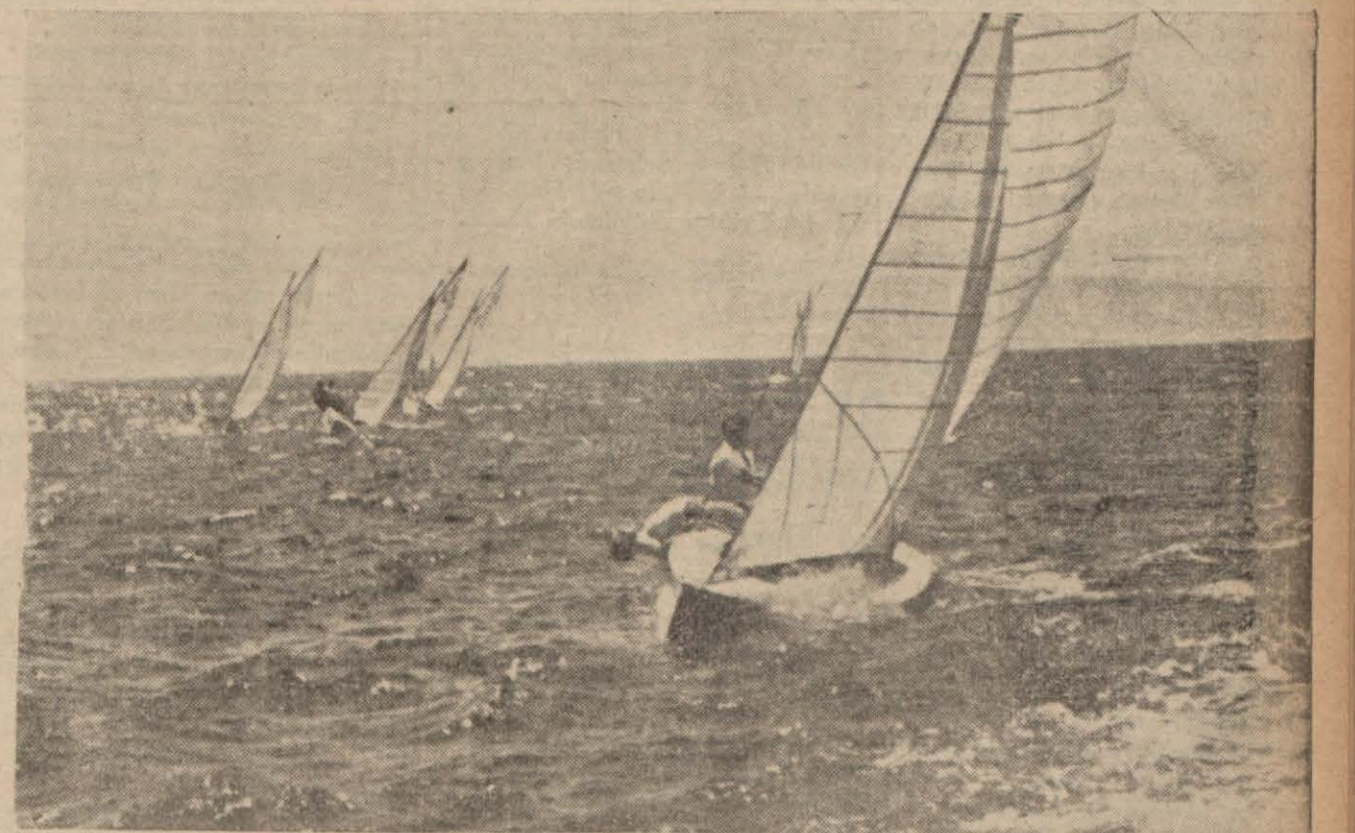
Dünkü yelken yarışlarından güzel bir görünüş

Dünkü yelken yarışlarında sert havadan iki tekne battı